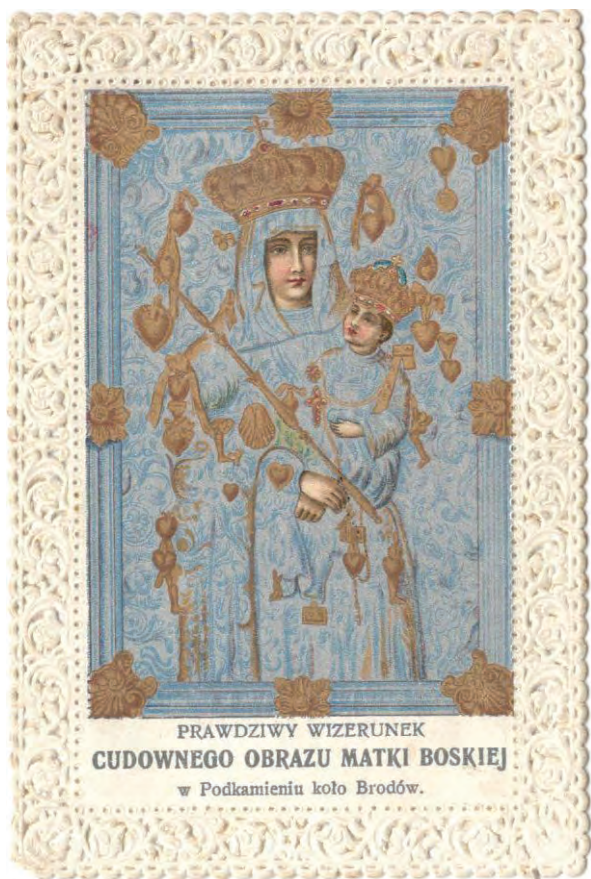
PRAWDZIWY WIZERUNEK CUDOWNEGO OBRAZU MATKI BOSKIEJ w Podkamieniu koło Brodów.