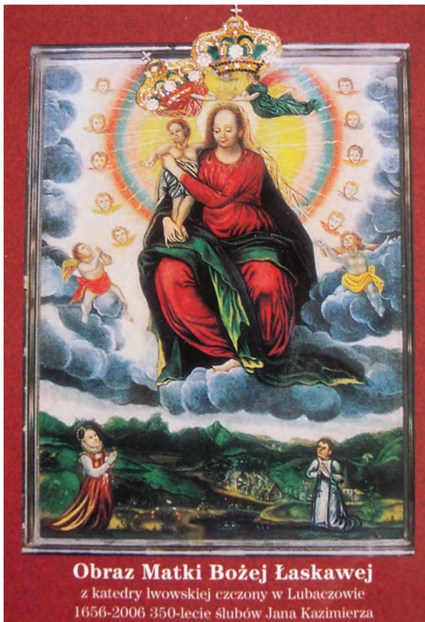
Obraz Matki Bożej Łaskawej z katedry lwowskiej czczony w Lubaczowie 1656-2006 350-lecie ślubów Jana Kazimierza