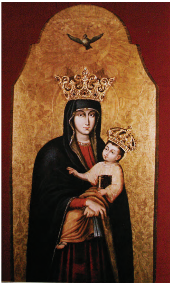
OBRAZ MATKI BOSKIEJ POCIESZENIA